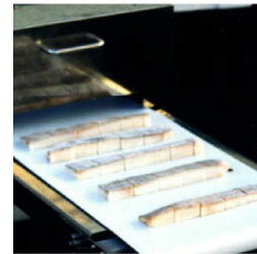
冷凍魚ブロックの角切り(2回通し) FGM400E型