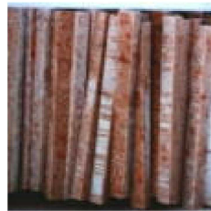
冷凍マグロのテッパン加工 FGM400E型