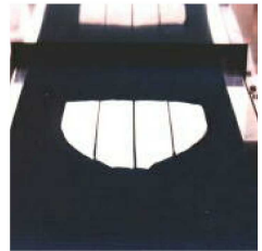
冷凍イカの柵取り加工 FGM400A型