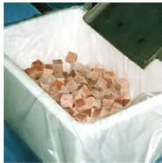
冷凍マグロの角切り(2回通し) FGM400E型