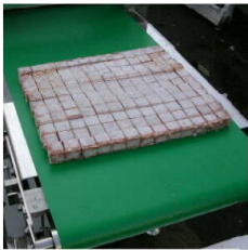
冷凍結着肉の角切り(2回通し) FGM400E型